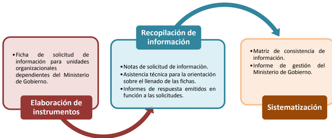
Ilustración 2. METODOLOGÍA